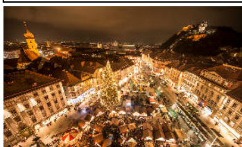
Foto vom Gasthof Alte Münze